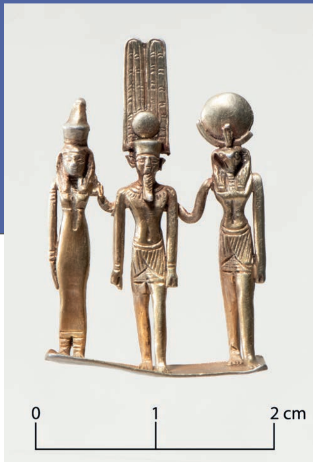
The Gold Theban Triad: Mut, Amun-Ra and Khonsu