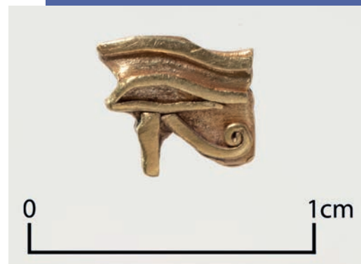
Gold Udjat-Eye amulet