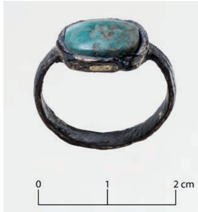
Copper alloy ring with gold leaf and a malachite stone.