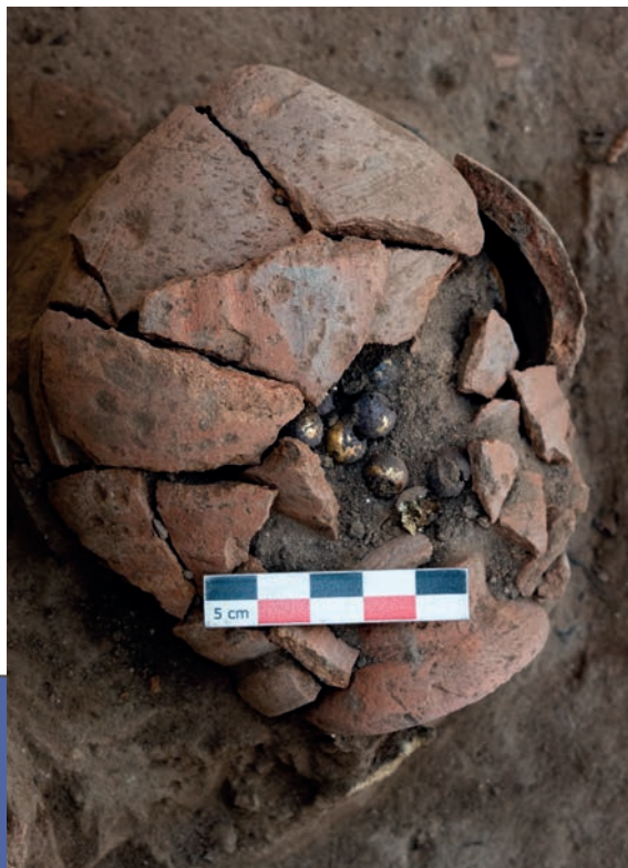
The ceramic pot and its gold and precious content during the excavation