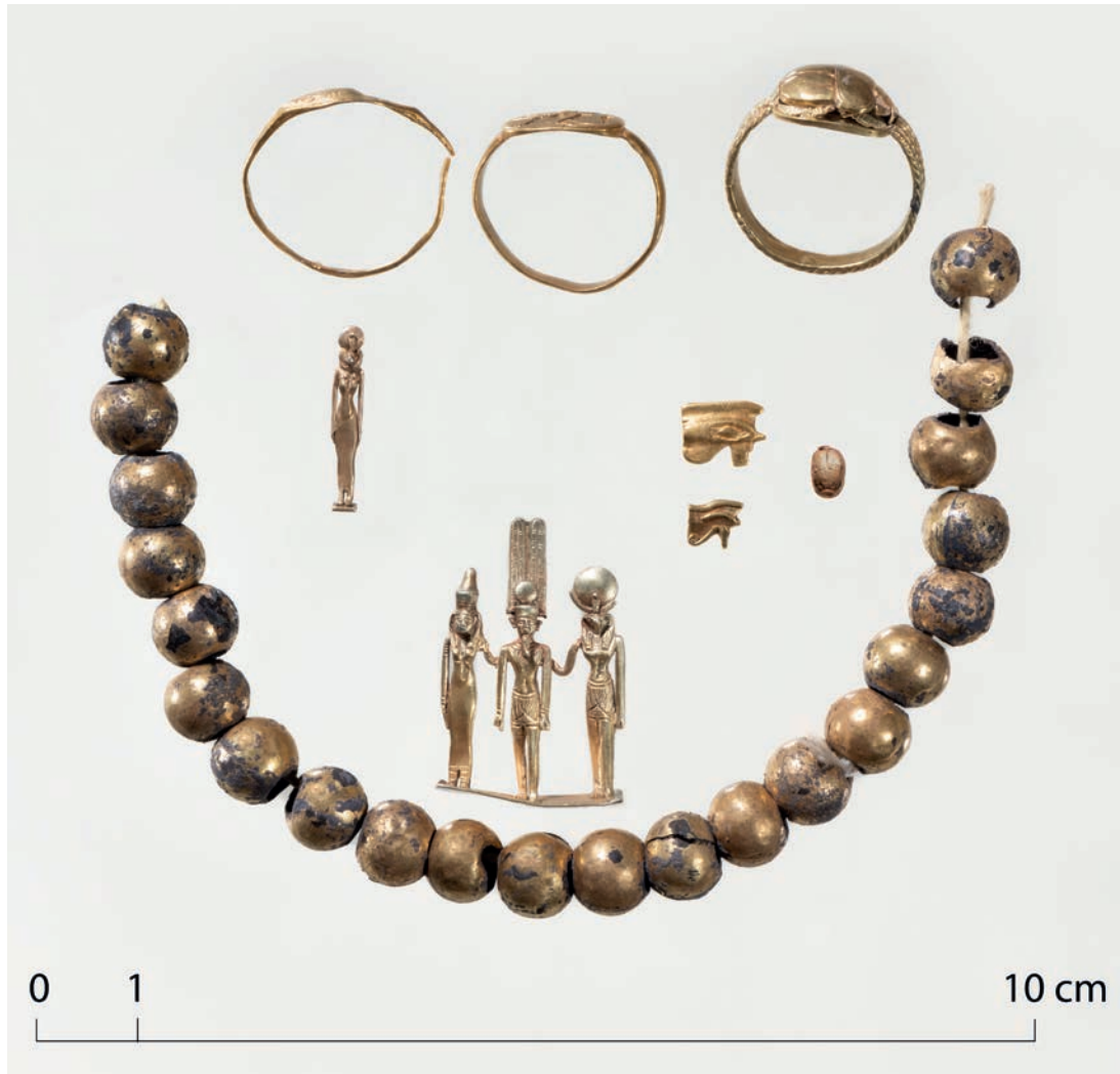
Gold artefacts from the «treasure» discovered by the CFEETK