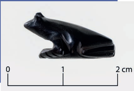
© CFEETK/K. el-Dowi and A. Rubi / Magnetite frog

تلك الحفائر سوف تساهم في فهم أفضل لطبيعة المنطقة الواقعة شمال الكرنك ومعرفة مراحل تطورها خلال الألفية الأولى قبل الميلاد.